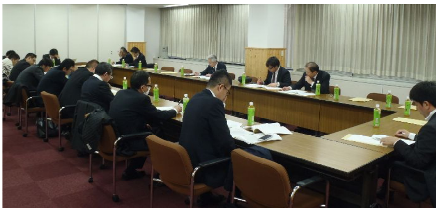
東京・後楽にある林友ビルで開催された第4回フローリング張り仕様書改正委員会 ＝12月5日午後4時

この平成27年版の発行は、平成27年3月1日の予定で、前回同様東京・大阪・名古屋の三都で説明会が予定されています。