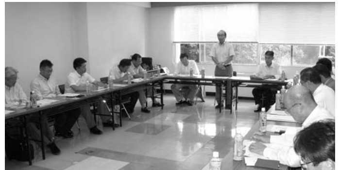
札幌で開催された生産部会の第2回定例会議

次に施工流通部会からは「フローリング市場の現状と見通し」について各社から発言された。「マンションは来年にならないと着工は増えない」「仕事の絶対量が少ない。職人の手間賃が安くなりすぎて辞めていく現象が起きている」「4月までは昨年より良かったが5～7月は散々。保育園や幼稚園の仕事が出てきているので期待しているが、先行きマンションは不安だ」「林野庁は杉や桧を推奨し、大型物件に対応できるか聞かれる。地域材では対応できないケースも見られる。需要が出てくることには期待しているが、体制を整えることも必要だ」「夏休み工事が多く、キャパを超えている。そんななかでなんとか終わったが、サンダー塗装が多く、本格的な改修が出なくなるのではと心配している」などと状況が報告された。